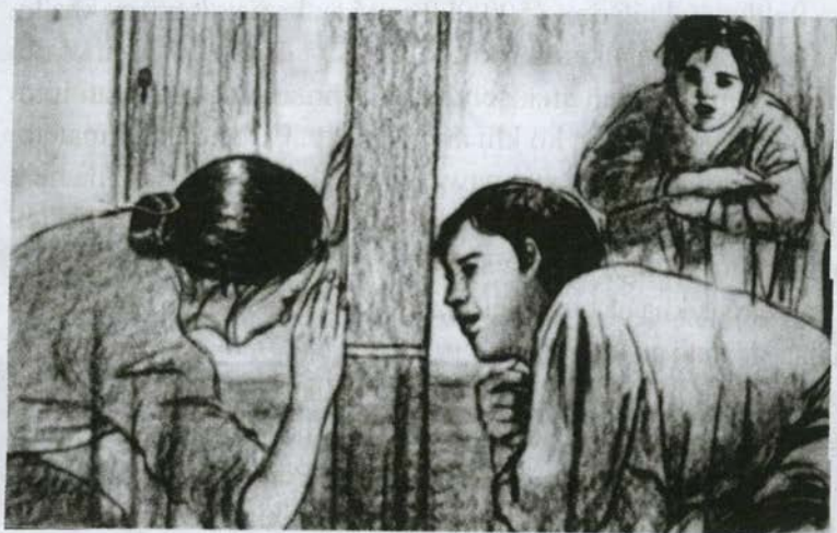
Mau chonmi van kha a kam i a hei bih lio

Fa pathum ka ngei. Upa bik cu nu a si i, a nau hi pa a si, a hniang bik hi nute a si i kumli lawng a si rih. Hihi kan i chonh lio ah hin, ka fanu hniang bik hmuh duhnak lungthin ka ngei. Kan pa nih keimah zoh dingah a hun hruai, ka fa kha tap lo dingin le ka sin i rak tek lo dingin Bawipa nih a bawmh. Palik pawl nih an zohtermi hmanthlak phunphun a zoh i ai nuam ngai.