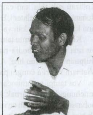
Thangthatnak hla a sa