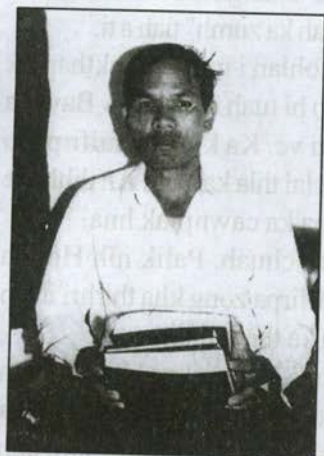
Dieu Dung an pekmi Baibal hna

Thongtla pakhat nih midang an hawipa kha hei ka sawhpiak i,