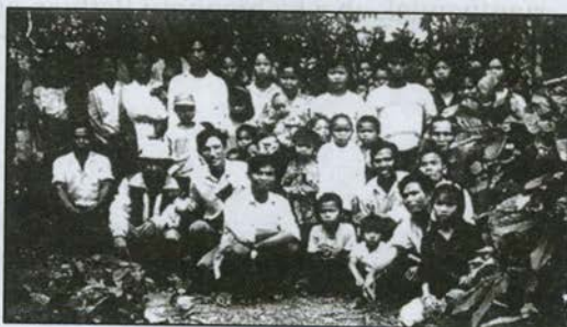
1975 in khan Khrihfa thong tampi hna cu a tli in inn ah siseh ramchung ah siseh hi bu hna bantukin pumh le tonnak an ngei tawn.

hnuah, ca kha an ṭial i an ka thlah. Palik cheukhat pawl hi zaangfahnak an ngei ve ko. Nihin ni palik tampi nih cun Baibal hi ze i a si ti awk an hngal lo i annih nih cun ramdang biaknak nih a hamhmi hna an si tiin an kan ruah. Hitluk rianrang i a karh hi zeiruang ahdah a si ti