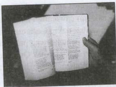
Linh nih cauk a tliir lio

Hiti kan i ton hnu caan rau lo ah, biakinn pumh kha ka hmang ve cang. Ka ðuanpi hawi palik pawl nih hin hi kong hi zehmanh an hngal lo. Chun caan ah ka bicycle hi kai cuan i pumh ah cun biakinn ah kal i pumh hi ka duh tuk cang caah tlaihkhieh va ton ding zong khi ka ðih kho ti lo.