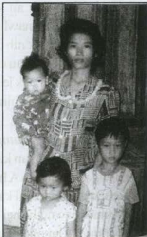
A chungkhar nih Dinh Trung luat lai an i hngahhlang

Palik nih an ka hrocernak kha ai khat ko, nehsawhnak le ningzah thlaihna a phunphun an ka tuah." A phunglo ning in phung na chim tiah an ka ti.