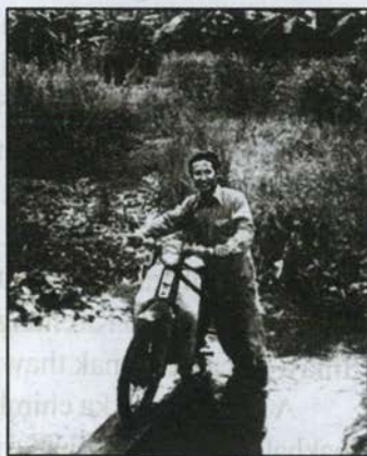
A upa Vo

Sihmahsehlaw nikhat cu Bawipa nih ka nun ah rianquan hram a thawk. Kapa cu a zawt a