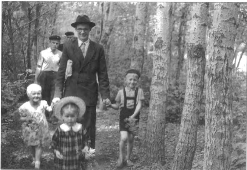
Дар с.1900 – Рафтан ба „Мақтаби якшанбеғӣ“ -и дар ҷангалҳои Иттиҳоди Шӯравӣ. Мақтаби якшанбеғии пинҳонӣ имрӯзҳо ҳам дар Виетнам, Лаос, Хитой, Бутан, Ғарби Миёна ва дигар территорияҳо волеҳӯрад.