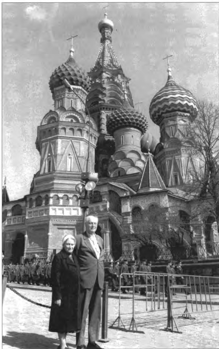
Дар суҳанронӣ ба калисоҳои пурфайзи Русия Ричард ва Сабина Вурмбранд дар давоми ҳаёти худ оиди фурӯ афтидан Пардаи Оҳанин шаҳодат медоданд.