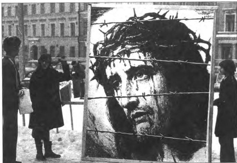
Шўъбаи Финляндиягии Садои Риёзаткашон (VOM) масеҳиёни дар банд бударо дар ёд дорад (Ибриён 13:3).