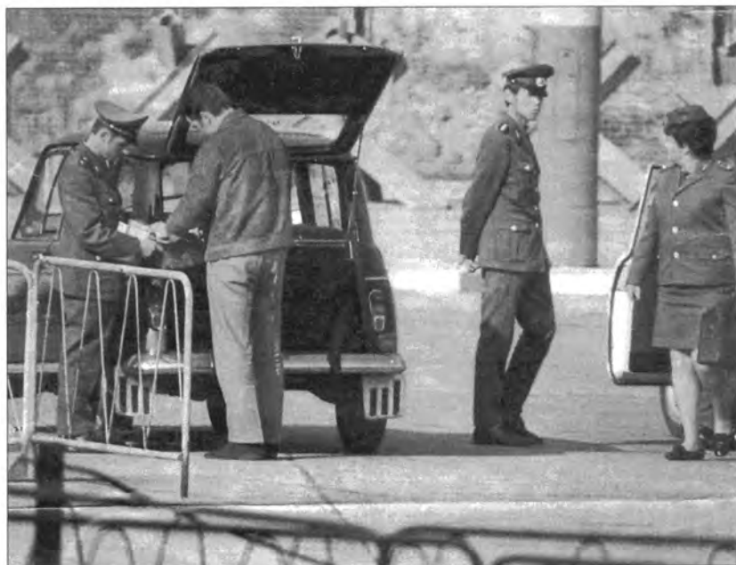
Посбонони сарҳади Германияи шарқӣ барои кофтукови Китобҳои Муқаддаси „гайрқонунӣ“ деворҳо ва дарҳои мошинҳоро шикӯф мекарданд.