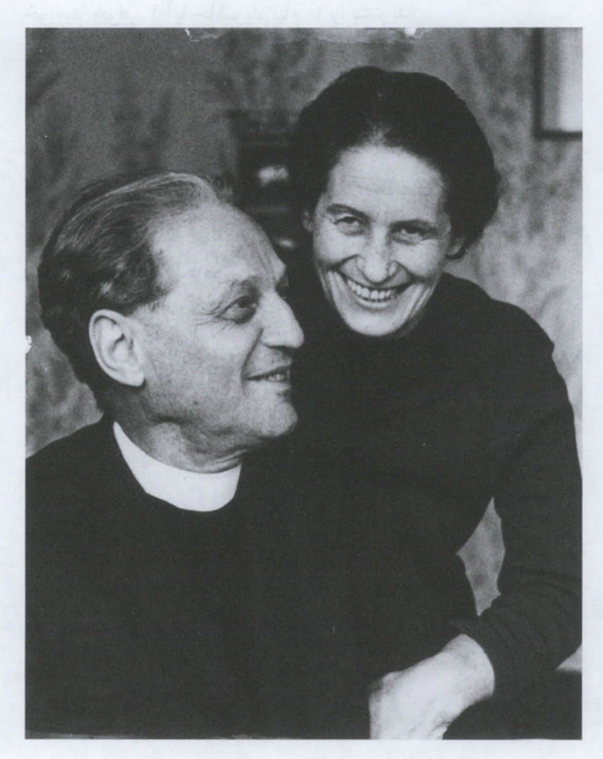
ریچارد وورمبراند و همسرش سابینه