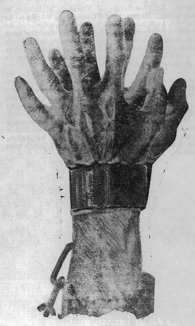
Ka Kti Ba La Pynmong Na Ka Bynta u Khrist